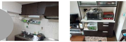
古くなり劣化や故障が起きていました

お客様が望んでいたリフォームと一緒にさせて頂きとても有難かったです！キッチンやLDKがとっても明るくなり、お客様のセンス溢れるオシャレな空間に仕上がりました。ありがとうございました。