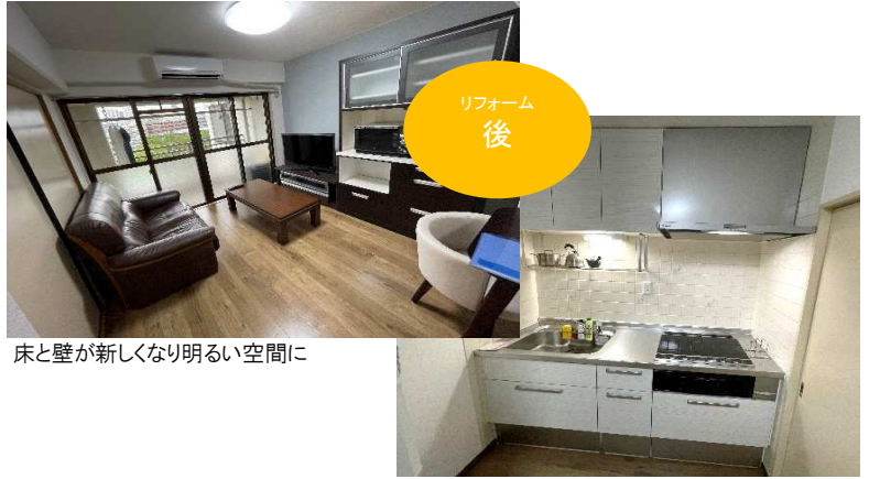
床と壁が新しくなり明るい空間に