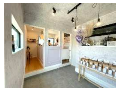
アクセサリやドライフラワーの販売有