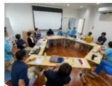
突然のみんなからの質問タイムに新人も教育係の先輩もビックリ(笑) 先輩社員の想いも感じられ、ほっこりした雰囲気(^^)