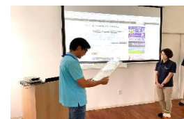
配管業務に日々向き合っている配管チームの3人は社内表彰されました！