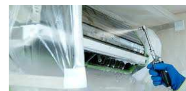
機械を使って内部の内部まで高圧洗浄します。