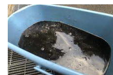
洗浄した後の水です。汚れを取り切ります！