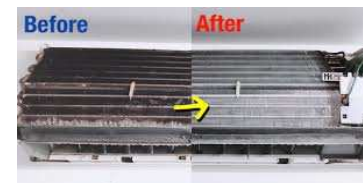
この汚れでは臭いも出ます(*ノノ)