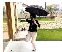
スタッフ上村がジャンプしても滑らない！