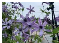
大竹美代子【繋ぎ役】

クレマチスの流星が綺麗に咲いています。知り合いの庭で撮影させていただきました。なかなか手に入らないレア物です。涼しげでとても華やかで目をひきます。私の庭にもお迎えしたい花の一つです。