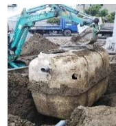
水道工事と下水道工事には卓越した知識・経験・安全管理能力が求められます